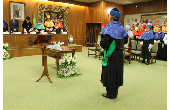
Fig. 12.- El Maestro de Ceremonias saluda al Rector, indicando que se puede proceder con el acto académico solemne.

El Rector, o quien presida el acto, hará uso de la palabra de pie, cubierto y desde su sitio, sin que en esta ocasión deba desplazarse el Maestro de Ceremonias. Toda persona que, siendo profesor, deba hablar en el acto, lo hará cubierto, pero sin guantes.