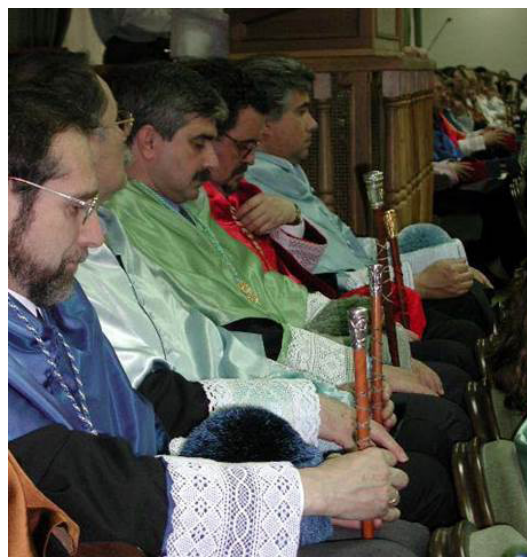
Fig. 7.- Hasta la Ley Orgánica 4/2007 de Universidades, los decanos de universidad recibían el tratamiento de Ilustrísimo.

Aunque el cargo de Secretario General de la universidad y sus funciones son conocidas en la universidad desde antiguo no se menciona su tratamiento en ninguna ley o re-